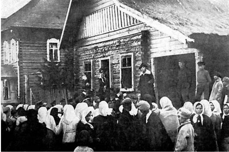
ගමක ගොවියන් අමතන කොමියුනිස්ට් පක්ෂයේ කථකයෙක්

රාජ්‍ය නය සැපයීමෙන් සැලසුම් සහගත කර්මාන්ත වර්ධනයක් ආරම්භ කිරීමේ අවශ්‍යතාව අවධාරනය කල ට්‍රොට්ස්කිගේ අදහස් සමග - මේ අදහස දැරූ තවත් අය අතර ප්‍රියෝබ්‍රෙෂෙන්ස්කි ද සිටියේ ය - මේ ආස්ථාන ගැටුනේ ය.